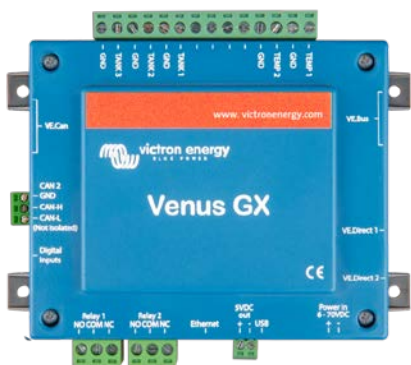
Venus GX con conectores