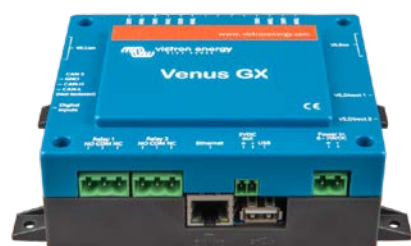
Ángulo frontal del Venus GX